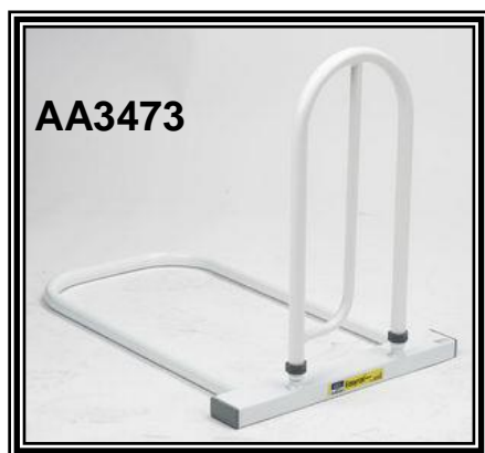
Adatta a letti normali