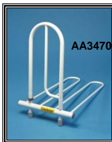
adatta a letti elettrici, con cinghie di fissaggio